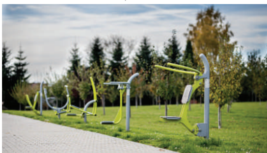
Siłownia plenerowa „Meblometu”

- Zastanawiamy się, czy obok stałej produkcji kontraktowej nie chcielibyśmy podjąć próby powrotu na rynek z własnymi produktami - mówi Iwona Potaczek. - Jesteśmy na etapie rozważań w obszarze mebli ogrodowych, jednak nie wykluczamy też innego asortymentu. Gospodarcze wyzwania stawiają nas niekiedy przed trudnymi decyzjami, jednak jesteśmy pewni, i dotychczasowe