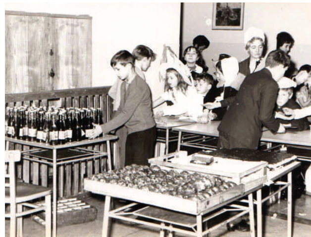
Zbiórka makulatury zorganizowana przez SU w Szkole Podstawowej w Mętowie (woj. opolskie). Lata 60.