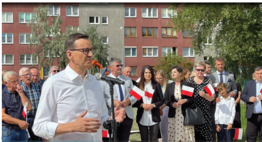
Prezes Rady Ministrów Mateusz Morawiecki na tle bloku zarządzanego przez Spółdzielnię Mieszkaniową „Przodownik” w Tomaszowie Mazowieckim

Na konferencji prasowej, która odbyła się 4 września br. na terenie osiedla Niebrów w Tomaszowie Mazowieckim Premier Mateusz Morawiecki ogłosił program „Przyjazne Osiedle”. Ma on być „filarem” programu wyborczego PiS i obejmować kompleksową modernizację osiedli mieszkaniowych wybudowanych w technologii wielkiej płyty. Problem w tym, że 80 proc. budynków spółdzielczych jest już ocieplonych, a pieniądze z KPO - które mogłyby posłużyć dalszej rewitalizacji osiedli - wciąż pozostają zablokowane.